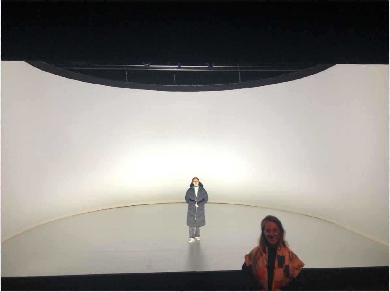
Rondhorizon en witte balletvloer